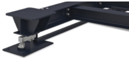
Instalación sobre solera de hormigón