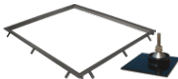
Marco para empotrar con placas de anclaje