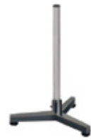
Columna en acero pintado