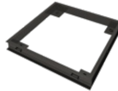
Cubilaje para empotrar