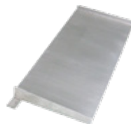
Rampa de acceso