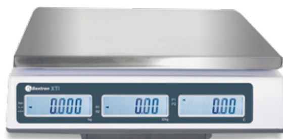
Tres pantallas comprador retroiluminadas