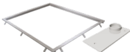
Marco para empotrar con placas de anclaje en acero inoxidable