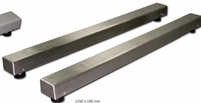
1250 x 100 mm

Plataforma de 4 células | Plate-forme avec 4 capteurs | 4 load cells platform