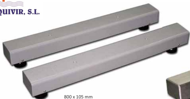
800 x 105 mm