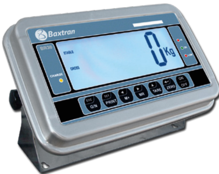
Visualización de funciones en pantalla